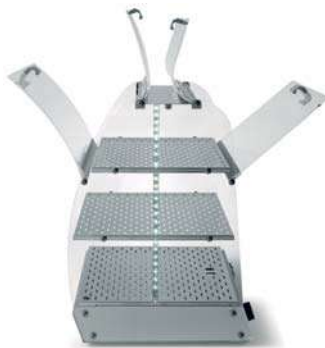
VISTA P3 BOLD