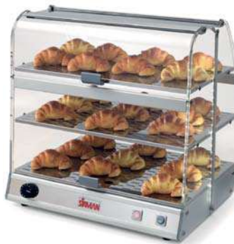
VISTA P3 BOLD BRIOCHE