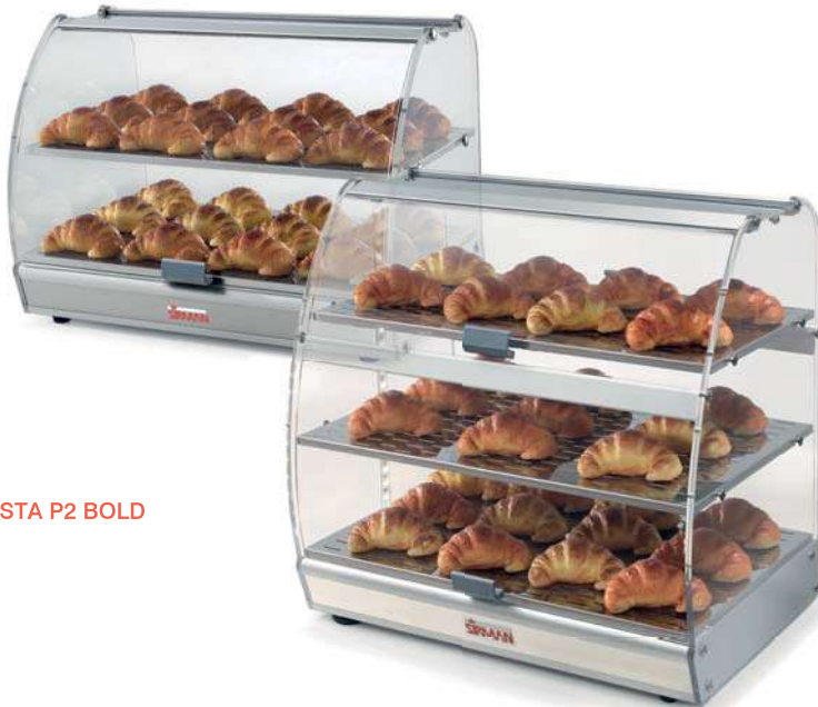
VISTA P2 BOLD