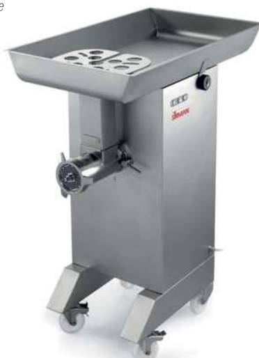
TC 32 MONTANA Y12