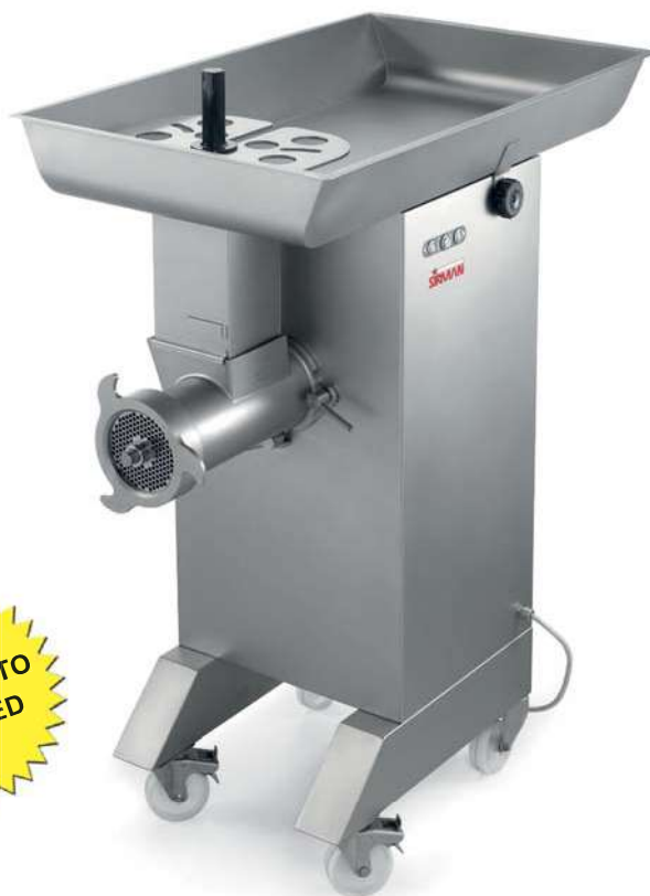
TC 42 MONTANA Y12