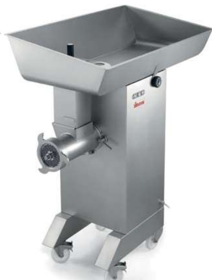
TC 32 MONTANA Y12