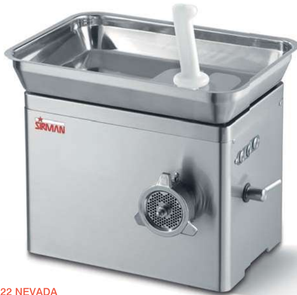
TC 22 NEVADA