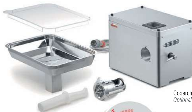
Coperchio opzionale Optional lid