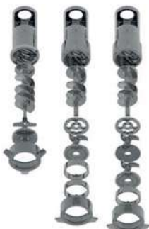
Standard o enterprise 1/2 Unger Unger Totale