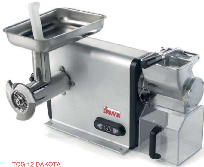
TCG 12 DAKOTA