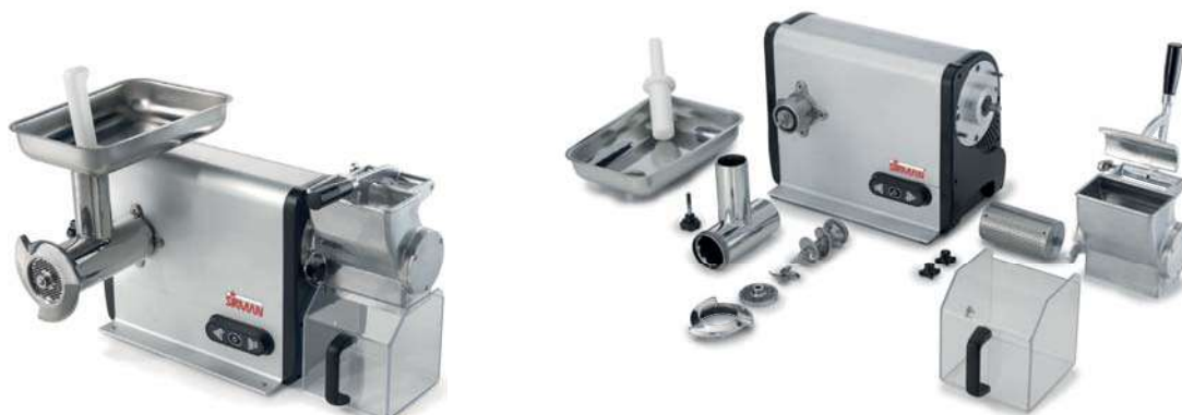
TCG 12 DAKOTA