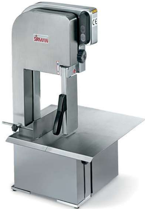
SO 1650 BREMEN