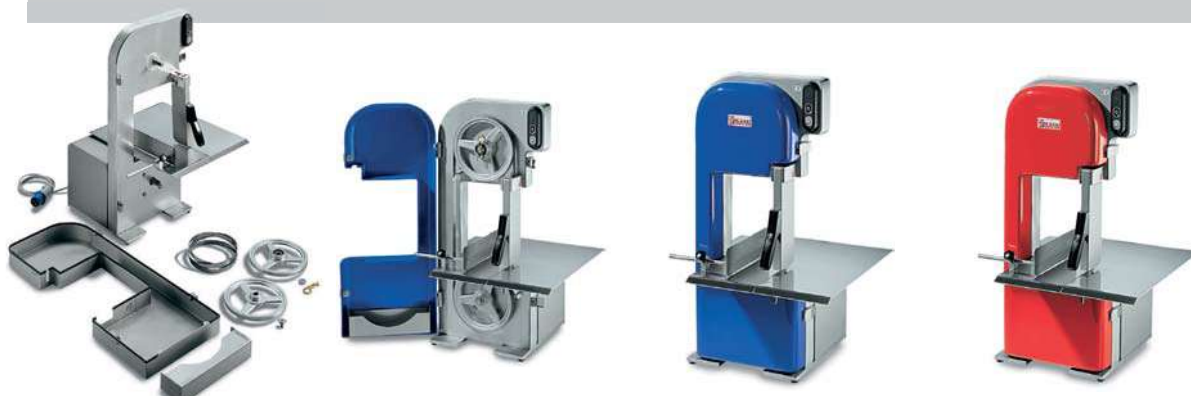
SO 1650 BREMEN