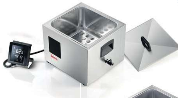
SOFTCOOKER SR 2/3 WI-FOOD