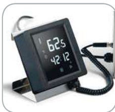
Comandi touch Touch controls.