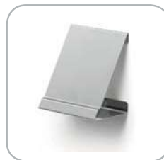
Pratica staffa di posizionamento per la scatola display The practical positioning bracket for the display box