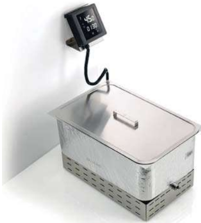
SOFTCOOKER SR BI 1/1 WI-FOOD