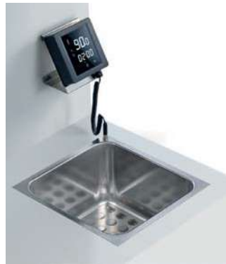
SOFTCOOKER SR BI 2/3 WI-FOOD