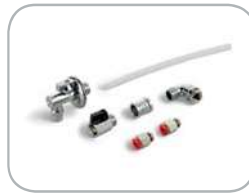
Kit collegamento scarico acqua opzionale Optional water discharge device connection kit.