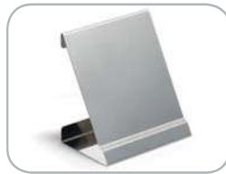
Pratica staffa di posizionamento per la scatola display The practical positioning bracket for the display box