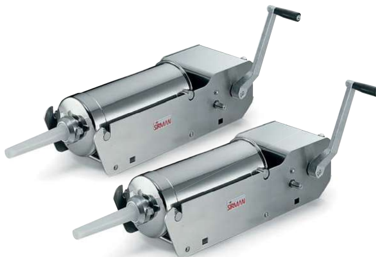
IS 8-16 ARIES