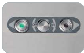
Comandi IP 67 in acciaio inox Stainless steel IP 67