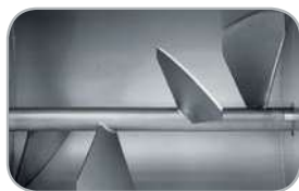
IP 50 M Y14