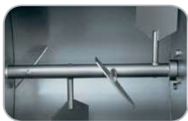
IP 30 M Y14