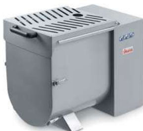
IP 30 M Y14

Gambe con ruote opzionali Optional legs with wheels