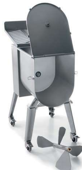
IP 30 M Y14