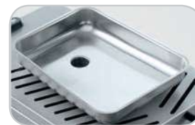
Opzione tramoggia per aggiunta ingredienti Optional feed tray for add ingredients