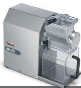
GFX HP 1,5