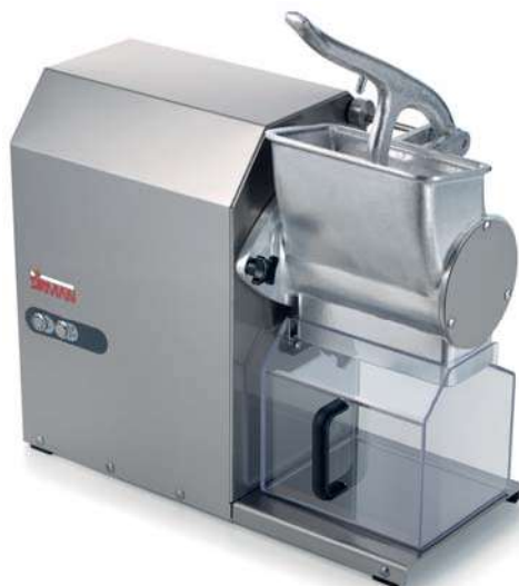
GFX HP 2