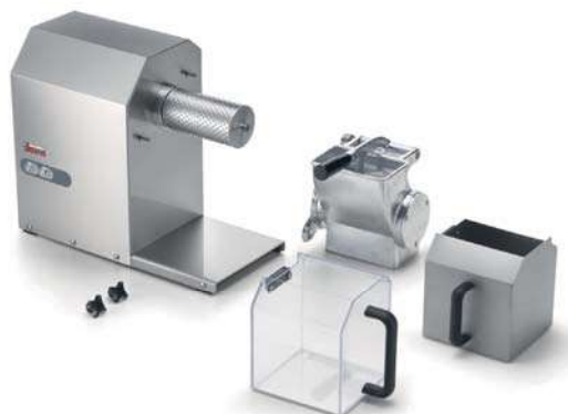
GFX HP 1.5-2