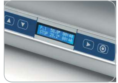
Visualizzazione immediata di tutte le informazioni The display shows immediately all available functions