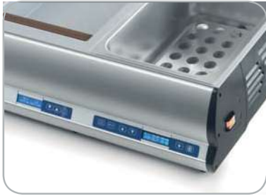
Controllo elettronico semplice ed intuitivo simple and intuitive electronic control