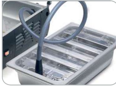
Tubo per aspirazione esterna opzionale External suction hose optional