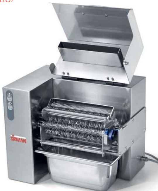
Vaschetta inox opzionale Optional s/steel tray