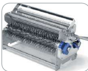
Gruppo lame inteneritrice con 96 lame Tenderizing blade assembly with 96 blades