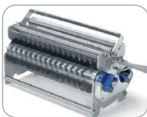
Gruppo lame taglio: da 10 mm con 48 lame 15 mm con 32 lame Cutting blade assembly: 10 mm with 48 blades 15 mm with 32 blades