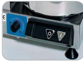
C4 VV - C6 VV - C9 VV