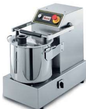
C15 DA BANCO