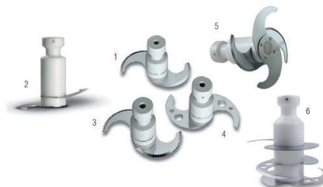
1. Lame di serie