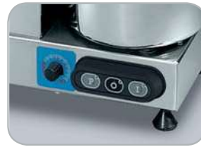
C4 - C6 VT (Variotronic)