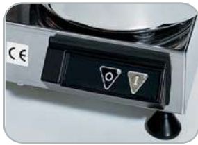
C4 - C6