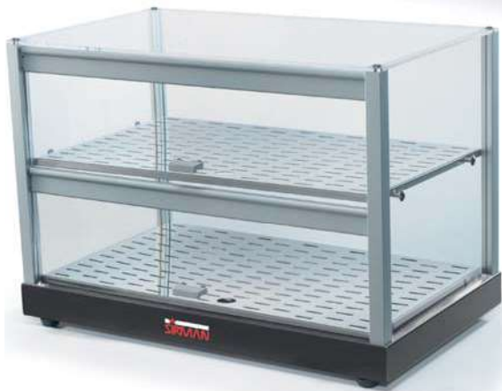
CUBE P2 N