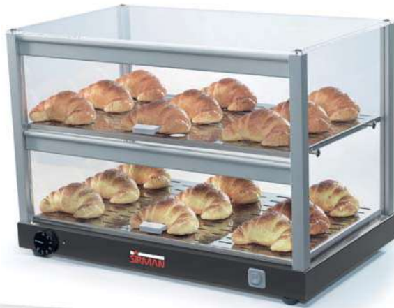
CUBE P2 HOT